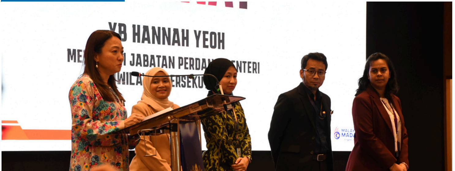
KETUA PEGAWAI EKSEKUTIF BERSAMA WARGA PKB MENGHADIRI MAJLIS AMANAT YB MENTERI DI JABATAN PERDANA MENTERI (WILAYAH PEREKUTUAN)