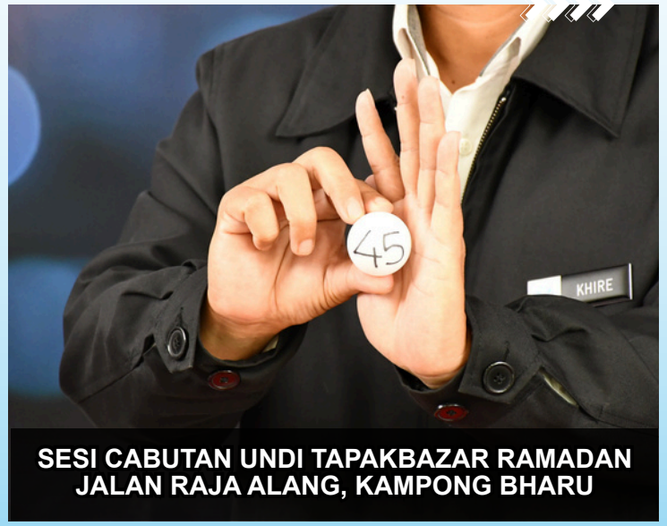
SESI CABUTAN UNDI TAPAKBAZAR RAMADAN JALAN RAJA ALANG, KAMPONG BHARU