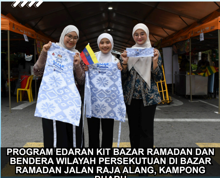
PROGRAM EDARAN KIT BAZAR RAMADAN DAN BENDERA WILAYAH PERSEKUTUAN DI BAZAR RAMADAN JALAN RAJA ALANG, KAMPONG BHARU