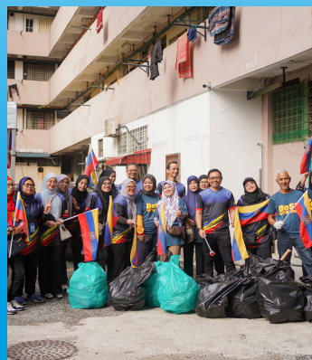
PROGRAM BERSIH SETIAP TEMPAT PERINGKAT KAMPONG BHARU