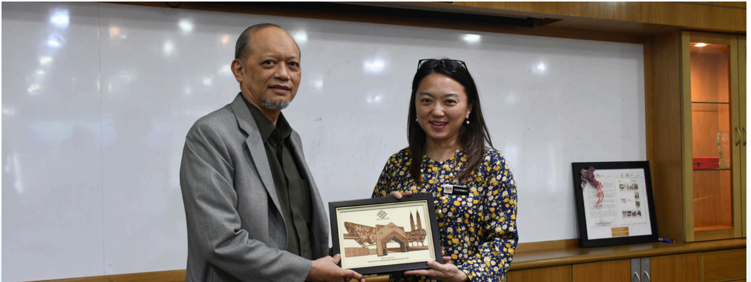
KUNJUNGAN HORMAT PENERUSI DAN KETUA PEGAWAI EKSEKUTIF KEPADA YB MENTERI DI JABATAN PERDANA MENTERI (WILAYAH PERSEKUTUAN)