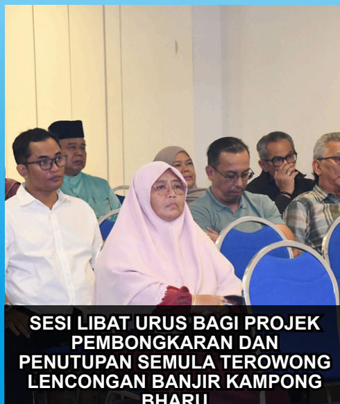
SESI LIBAT URUS BAGI PROJEK PEMBONGKARAN DAN PENUTUPAN SEMULA TEROWONG LENCONGAN BANJIR KAMPONG BHARU