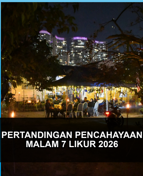
PERTANDINGAN PENCAHAYAAN MALAM 7 LIKUR 2026