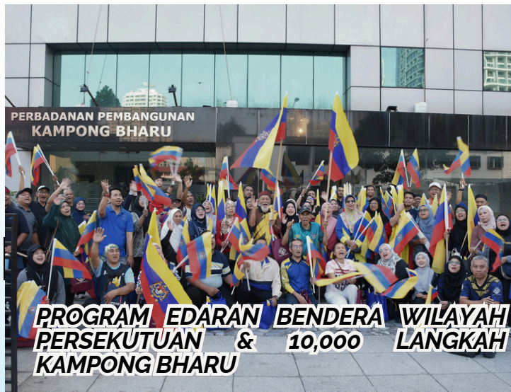
PROGRAM EDARAN BENDERA WILAYAH PERSEKUTUAN & 10,000 LANGKAH KAMPONG BHARU