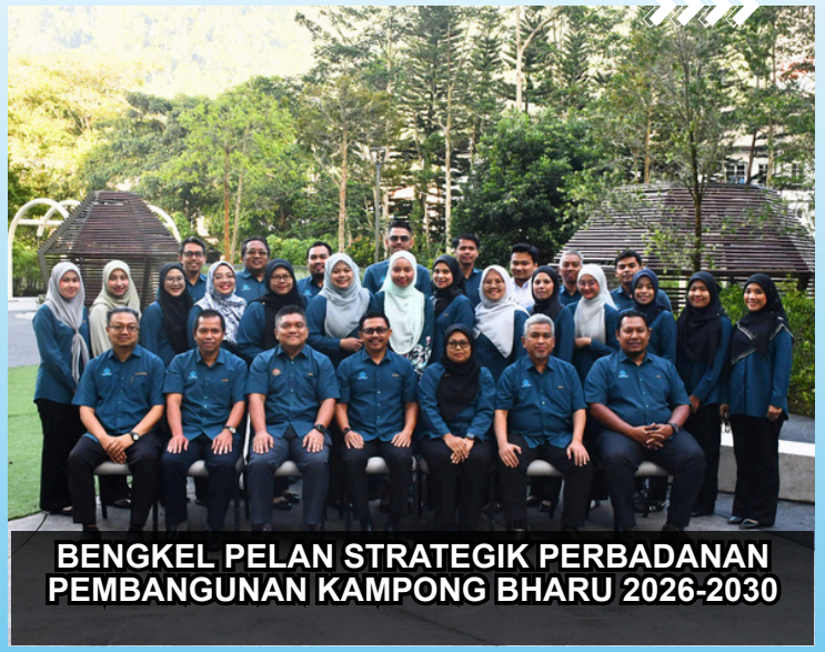
BENGGKEL PELAN STRATEGIK PERBADANAN PEMBANGUNAN KAMPONG BHARU 2026-2030