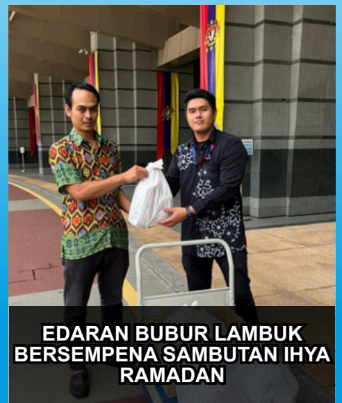
EDARAN BUBUR LAMBUK BERSEMPENA SAMBUTAN IHYA RAMADAN