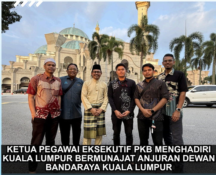
KETUA PEGAWAI EKSEKUTIF PKB MENGHADIRI KUALA LUMPUR BERMUNAJAT ANJURAN DEWAN BANDARAYA KUALA LUMPUR