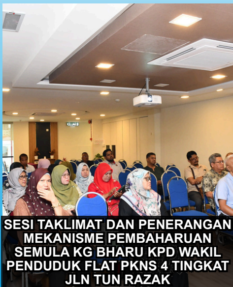
SESI TAKLIMAT DAN PENERANGAN MEKANISME PEMBAHARUAN SEMULA KG BHARU KPD WAKIL PENDUDUK FLAT PKNS 4 TINGKAT JLN TUN RAZAK