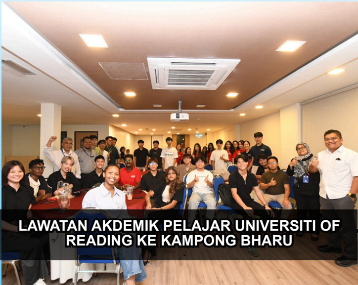
LAWATAN AKDEMIK PELAJAR UNIVERSITI OF READING KE KAMPONG BHARU