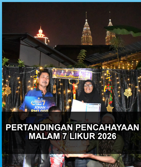
PERTANDINGAN PENCAHAYAAN MALAM 7 LIKUR 2026