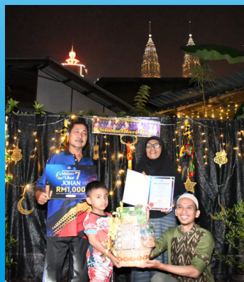
PERTANDINGAN PENCAHAYAAN MALAM 7 LIKUR 2026