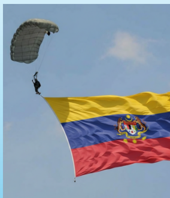
PERASMIAN PROGRAM BASEJUMP CHALLENGE 2026