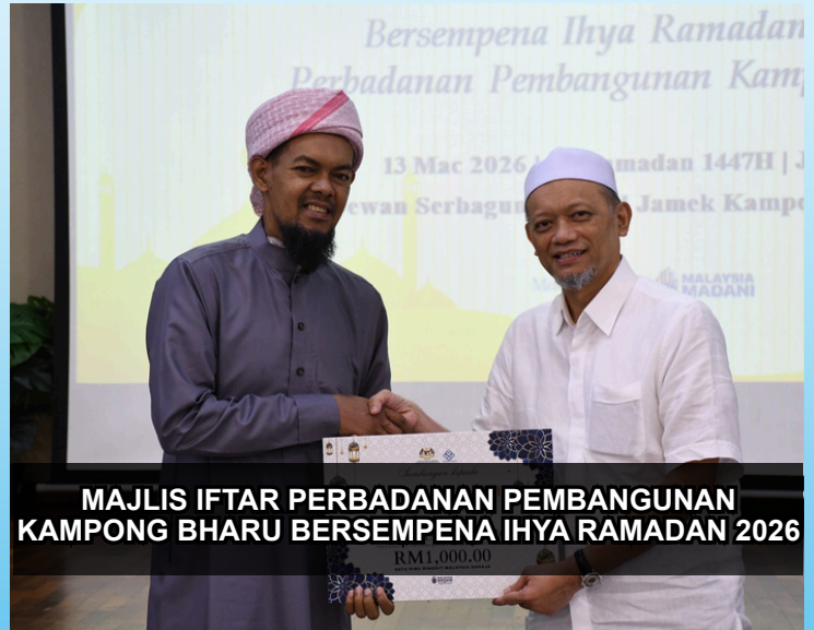
MAJLIS IFTAR PERBADANAN PEMBANGUNAN KAMPONG BHARU BERSEMPENA IHYA RAMADAN 2026