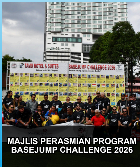
MAJLIS PERASMIAN PROGRAM BASEJUMP CHALLENGE 2026