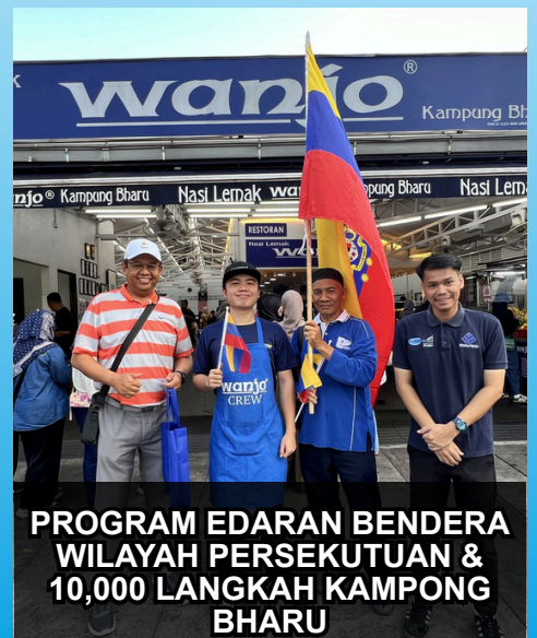
PROGRAM EDARAN BENDERA WILAYAH PERSEKUTUAN & 10,000 LANGKAH KAMPONG BHARU