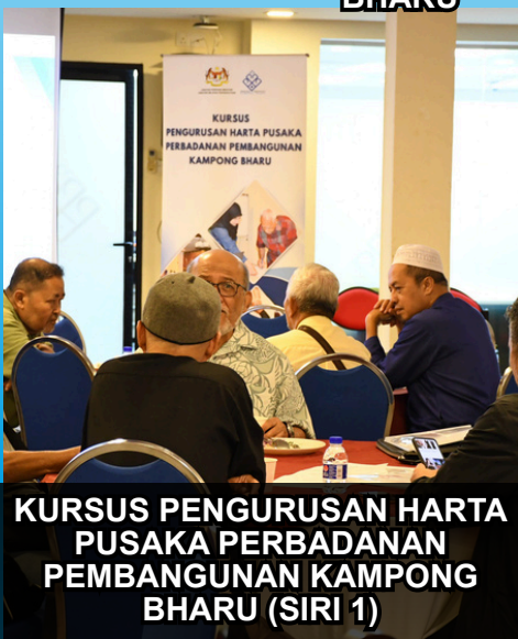
KURSUS PENGURUSAN HARTA PUSAKA PERBADANAN PEMBANGUNAN KAMPONG BHARU (SIRI 1)