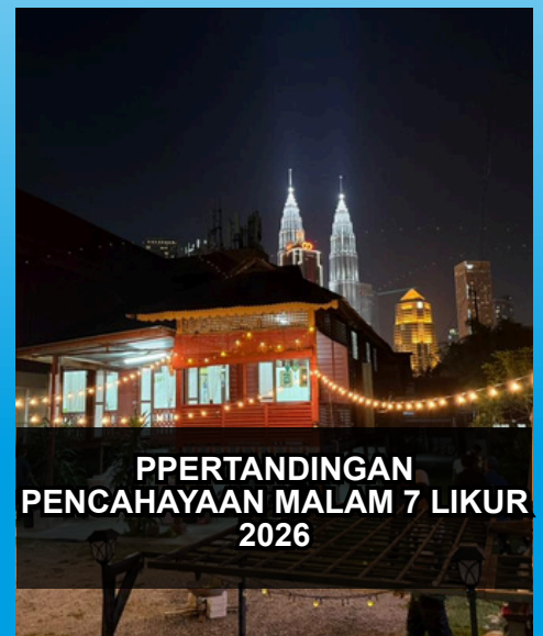
PPERTANDINGAN PENCAHAYAAN MALAM 7 LIKUR 2026