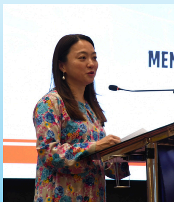
MAJLIS AMANAT YB MENTERI DI JABATAN PERDANA MENTERI (WILAYAH PEREKUTUAN)